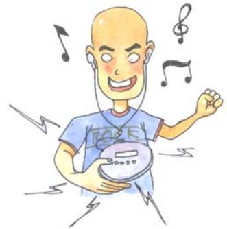
ฟังวิทยุ เครื่องเล่น CD ด้วยหูฟังและเปิดเสียง ดังมาก