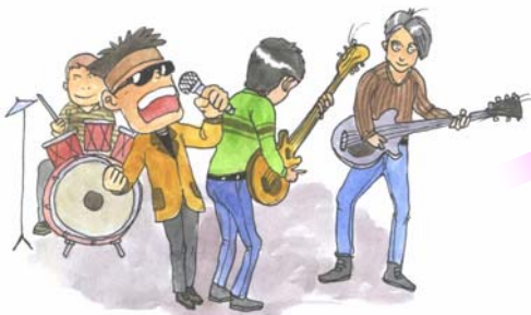
วงดนตรีคอนเสิร์ต