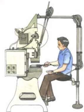
เครื่องจักร