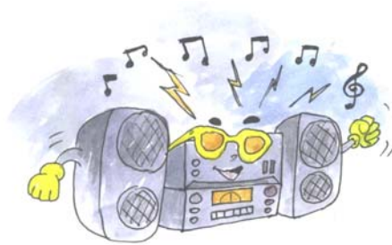
เปิดวิทยุเสียงดัง