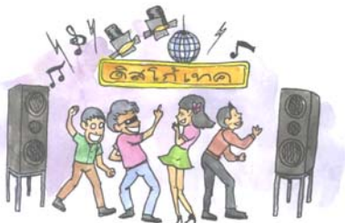
ดิสโก้เทค