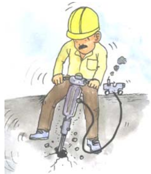
เครื่องขุดเจาะ