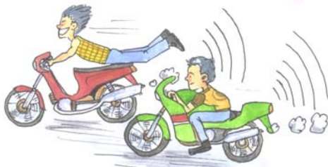
รถมอเตอร์ไซด์เสียงดัง รถซิ่งผิดกฎหมาย