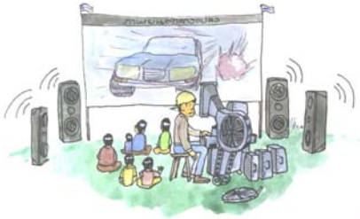
หนังกลางแปลง

ในหูชั้นในของเราจะมีเซลล์ขนที่เรียกว่า แฮร์เซลล์ มีหน้าที่รับคลื่นเสียงและส่งสัญญาณประสาทไปยังสมอง ทำให้เราได้ยินเสียงต่างๆ