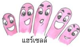
แฮร์เซลล์

ในหูชั้นในของเราจะมีเซลล์ขนที่เรียกว่า แฮร์เซลล์ มีหน้าที่รับคลื่นเสียงและส่งสัญญาณประสาทไปยังสมอง ทำให้เราได้ยินเสียงต่างๆ